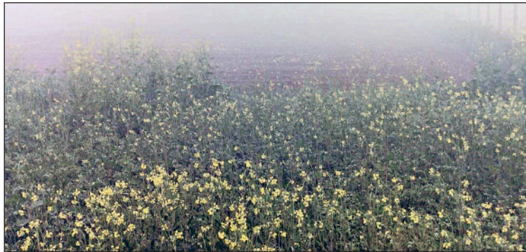
हिसार। सरसों की फसल पर छाई धुंध।

हाड़ कंपा देने वाली सूखी ठंड अपने तेवरो को प्रचंड किया हुआ है। लगातार दूसरे दिन भी हिसार का रात्रि पाठ 2.1 डिग्री सेल्सियस दर्ज किया गया। यह प्रदेश में सबसे कम है। दिनभर चली उत्तर-पश्चिमी हवाओं ने लोगों की कंपकंपी छुड़वाई रखी। हिसार व आसपास के क्षेत्रों में सुबह के समय घनी धुंध छाई रही। इसके कारण रेल व परिवहन सेवाओं का असर देखा गया। लंबी दूरी की रेलगाड़ियां हिसार रेलवे से अपने निर्धारित समय से 4 घंटे से भी अधिक देरी के साथ आवागमन कर रही थी। उत्तर-पश्चिमी हवाओं के कारण लोगों घरों और कार्यालयों में दुबके नजर आए। भीषण ठंड और कोहरे के चलते सबसे ज्यादा परेशानी स्कूली बच्चों को उठानी पड़ रही है। छोटे-छोटे बच्चे स्कूल बसों में दुबके हुए नजर आए। सुबह के समय गहरी धुंध और भीषण ठंड के चलते व्यस्त बाजारों में भी रौनक नहीं दिखाई दी। वहीं घने कोहरे के चलते वाहन चालकों को परेशानियों का