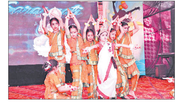
फतेहाबाद। अपेक्स कॉन्वेंट के वार्षिक उत्सव में प्रस्तुति देते विद्यार्थी।