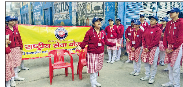
हॉसी। एनएसएस शिविर के दौरान नुककड़ नाटक प्रस्तुत करती स्वयं सेविकाएं।