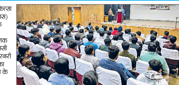
हिसार। ओरिएंटेशन कार्यक्रम को संबोधित करते वक्ता।