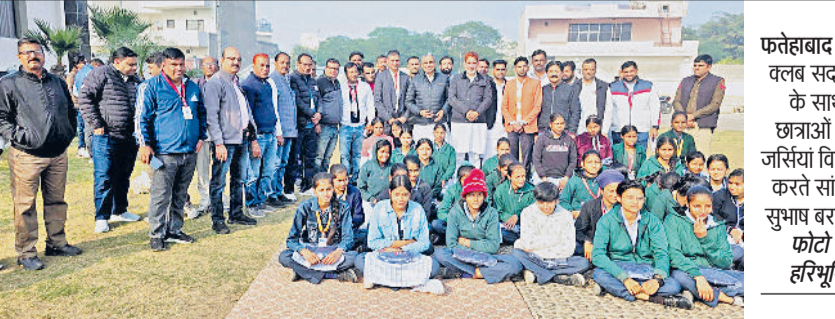
फतेहाबाद। प्रेस क्लब सदस्यों के साथ छात्राओं को जर्सियां वितरित करते सांसद सुभाष बराला।

राज्यसभा सांसद सुभाष बराला ने कहा कि गोरखपुर में बने रहे गोरखपुर परमाणु संयंत्र वर्ष 2029 तक बिजली उत्पादन शुरू कर देगा। इस संयंत्र के शुरू होने से फतेहाबाद सहित प्रदेश के अनेक क्षेत्रों में लोगों को पर्याप्त मात्रा में बिजली मिल पाएगी। सुभाष बराला सोमवार को यहां प्रेस क्लब द्वारा आयोजित जर्सी