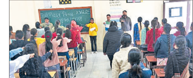
सिरसा। देवि वि शपथ ग्रहण समारोह में भाग लेते अधिकारी।