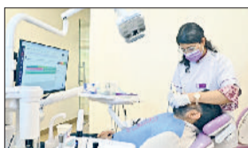
हिसार। दांतों की जांच करती डॉक्टर।