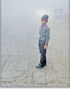
फतेहाबाद। धुंध में स्कूल बस का इंतजार करता छात्र।

जाखल। जिले के जाखल जंक्शन से गुजरने वाली कई ट्रेनें सोमवार सुबह घंटों देरी से चलीं। इससे यात्रियों को भारी परेशानी का सामना करना पड़ा। पातालकोट एक्सप्रेस 5 घंटे और हजूर साहिब गाँव एक्सप्रेस 3 घंटे की देरी से चल रही है। अन्य लंबी दूरी की ट्रेनों में फिरोजपुर कैंट एक्सप्रेस और फरक्का एक्सप्रेस सुपरफास्ट अपने निर्धारित समय से 2 घंटे की देरी पर रहीं। इसके अतिरिक्त, फिरोजपुर एक्सप्रेस, दिल्ली इंटरसिटी एक्सप्रेस, बठिंडा सुपरफास्ट और हिसार-जाँद पेंसेंजर जैसी ट्रेनें भी 30 मिनट की देरी से चलीं। ट्रेनों की लेटलतीफी के कारण जाखल जंक्शन पर यात्री ठंड में ठिठुरते नजर आए। अपने गंतव्य तक पहुंचने के लिए उन्हें रेलवे स्टेशन पर घंटों इंतजार करना पड़ा। कोहरे के कारण सुबह के समय दृश्यता भी काफी कम रही, जिससे सड़कों पर दोपहिया वाहन भी धीमी गति से चलते दिखे।